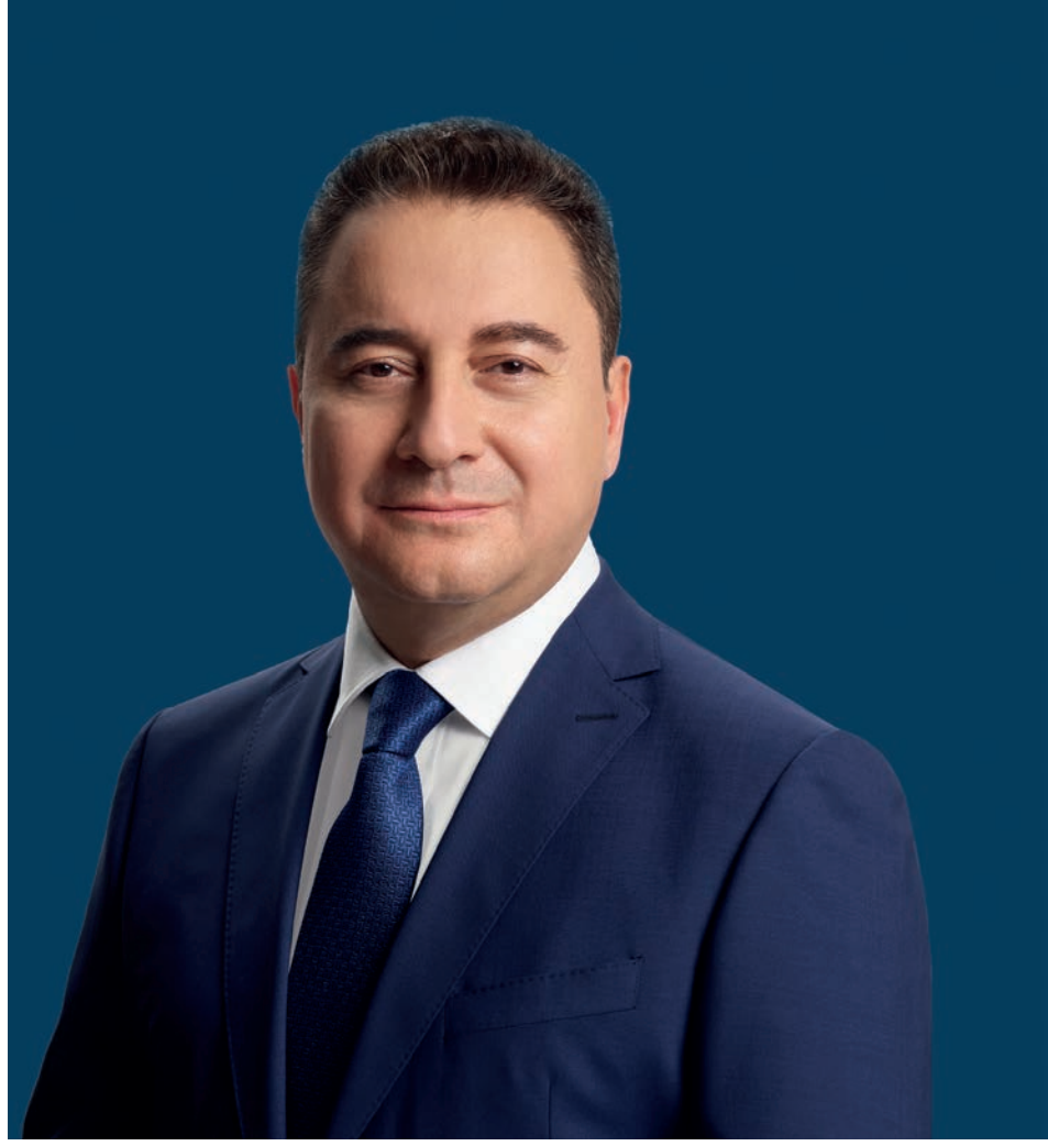
Ali Babacan DEVA Partisi Genel Başkanı

Ülkemizin yurt dışında yaşayan vatandaşlarımız ile bağları her geçen gün zayıflıyor.